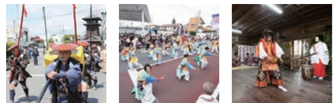
十萬石棚倉城まつり 4月中旬 棚倉夏まつり 8月14日 霜月大祭 12月第2土・日曜日

四季折々の行事に出掛けて、町の賑わいにふれるのも楽しいもの。季節を通して移り変わる、桜や紅葉の絶景も見逃せません。