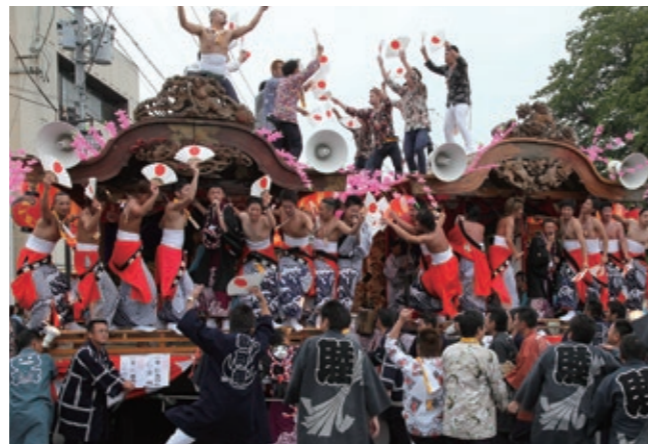
棚倉秋まつり 10月第2土・日曜日

棚倉町に約200年続く伝統行事です。大屋台が町なかにくり出し、囃子太鼓の演奏が行われます。2日間にわたる大迫力の興行に心も体も熱くなります。