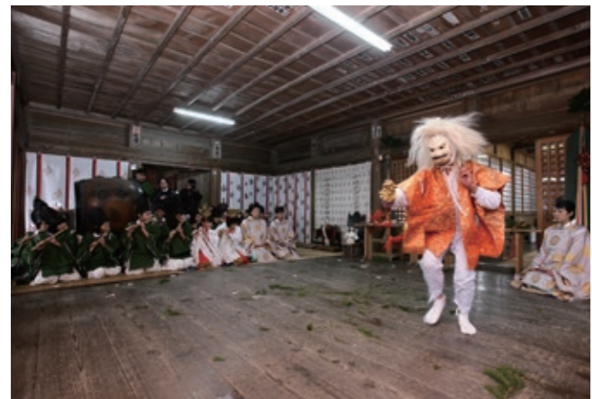
御田植祭 (国指定重要無形民俗文化財) 旧暦1月6日

穀物の豊穰を祈って神楽を奉納する伝統行事で、鎌倉時代の中頃から続くと伝承されています。方言や擬音をまじえたユーモラスなかけあいと舞に、心がひき込まれます。