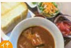
福島県産牛のビーフシチュー