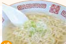
つるの湯ラーメン