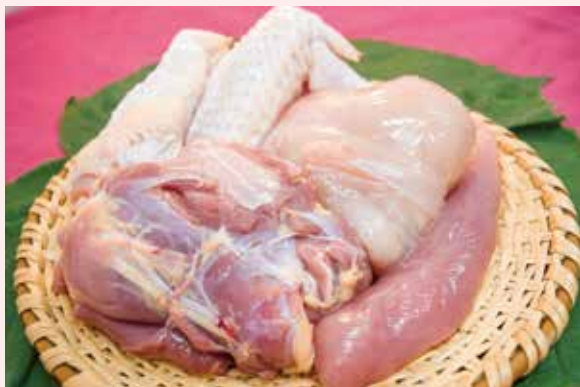
ご家庭でも会津地鶏が味わえます

会津地鶏はその昔、平家の落人が愛玩用に持ち込んだものが広まったと言われています。自由に動き回れる環境(平飼い)で、ストレスを感じることなく育ちます。飼育日数は約120日~140日とブロイラーの約2倍かけて飼育されます。