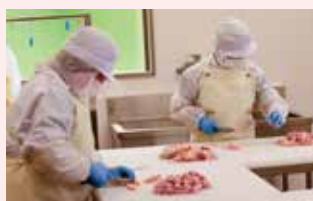
衛生的な環境で、1羽ずつ丁寧に加工します