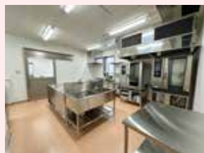
丸焼きも出来る調理器具も完備!