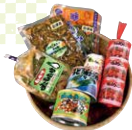
山菜加工品 各種 JA会津よつば三島支店