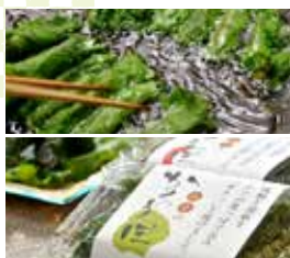
みそのかくれんぼ (しそみそ揚げ) 道の駅尾瀬街道みしま宿