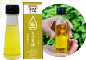
三島町産えごま油 桐の里産業㈱