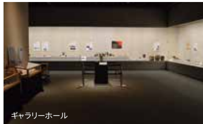
ギャラリーホール

三島町交流センター山びこは地域内外の交流や地域の活性化を目的とする文化施設です。ギャラリーホール・イベントホール等を備え、歴史文化や芸術文化に関する企画展・イベントを主に開催しています。詳しくはホームページをご覧ください。