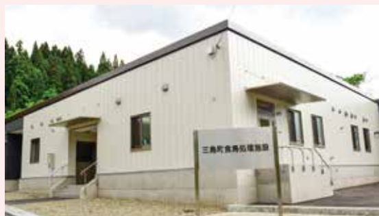
最新の設備を備えた新しい処理施設