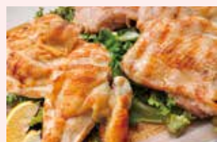
会津地鶏1羽を丸ごと味わえます!