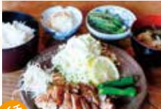
会津地鶏もも肉塩焼き定食