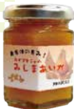
ほおずきジャム 「みしまあいか」 三島町名入地区