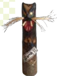
かしゃ猫(こけし) 夢紡匠庵