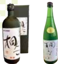
会津桐花焼酎「桐んこ」 会津清酒「桐むすめ」 山モ齋藤商店(ヤマザキショップ)