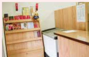
処理施設の受付には会津桐の製品が使われています

また、福島県の三大ブランド鶏の川俣シャモ、伊達鶏とコラボしたふるさと納税返礼品で、3種の鶏が味わえるお得なセットもあります。