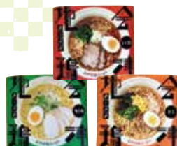
会津地鶏ラーメン (しょうゆ/塩白湯/みそ) (有)会津地鶏みしまや