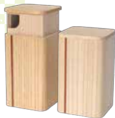
会津桐の茶綾(さや) 会津桐タンス㈱