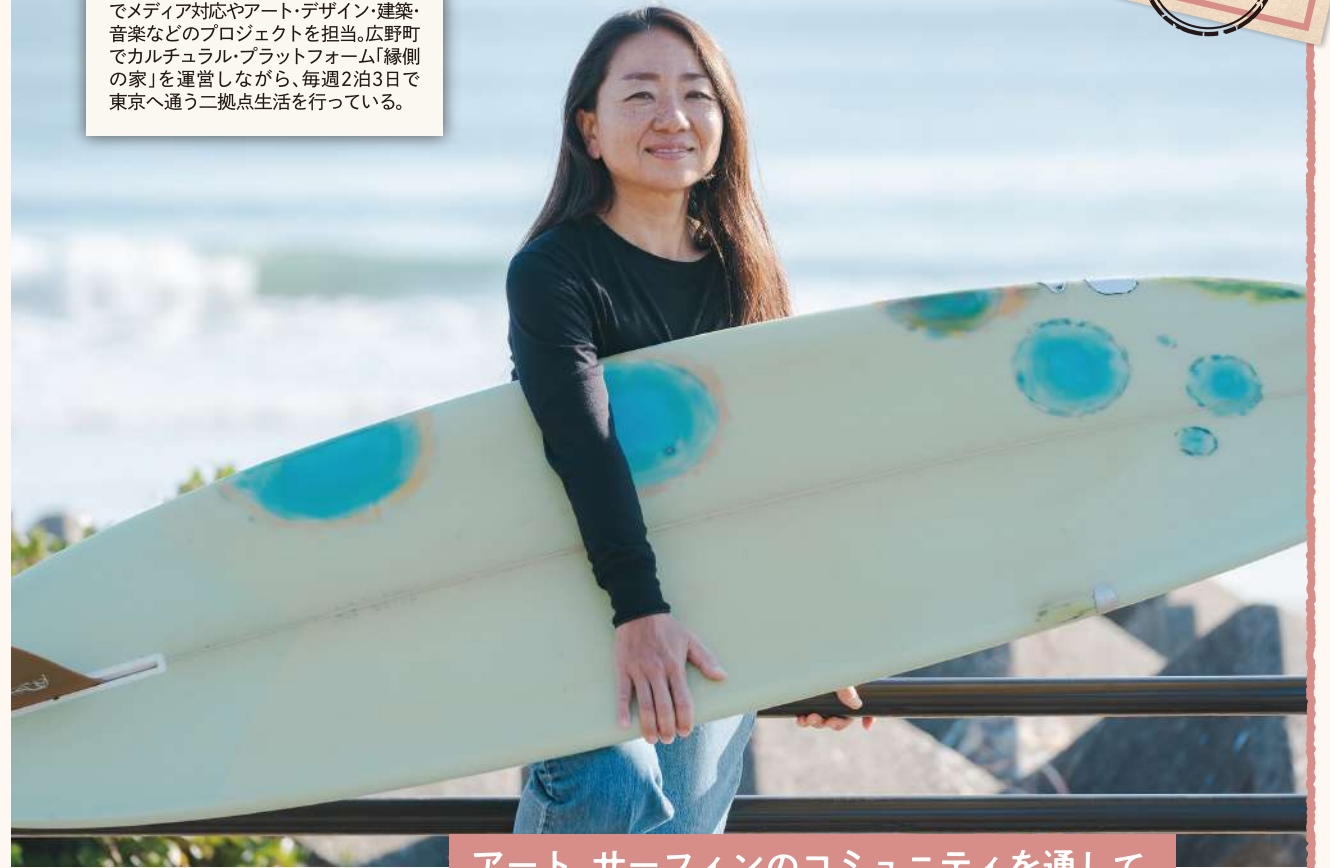
アート、サーフィンのコミュニティを通して、

広野町出身。東京学芸大学大学院修士課程修了(音楽学)。在学中・卒業後に世界各国を回り、現在は東京にある団体でメディア対応やアート・デザイン・建築・音楽などのプロジェクトを担当。広野町でカルチュラル・プラットフォーム「縁側の家」を運営しながら、毎週2泊3日で東京へ通う二拠点生活を行っている。