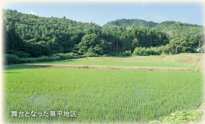
舞台となった穂平地区