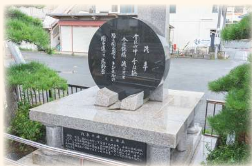
昭和57年に、作詞地を記念してJR広野駅構内に歌碑が建立されました。

今は山中今は浜 今は鉄橋渡るぞと 思う間も無く、トンネルの 間を通過して広野原(ひろのはら) 遠くに見える 村の屋根 近くに見える 町の軒 森や林や 田や畠 後へ後へと飛んで行く 回り燈籠の 絵のように 変わる景色の おもしろさ 見とれてそれと 知らぬ間に 早くも過ぎる幾十里