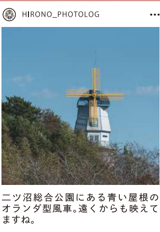
ニッ沼総合公園にある青い屋根のオレンジ型風車。遠くからも映えますね。