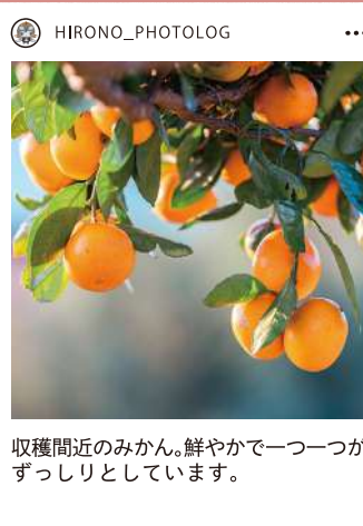
収穫間近のみかん。鮮やかで一つ一つがずっしりとしています。