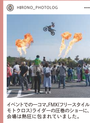
イベントでの一コマ。FMX(フリースタイルモトクロス)ライダーの圧巻のショーに、会場は熱狂に包まれていました。