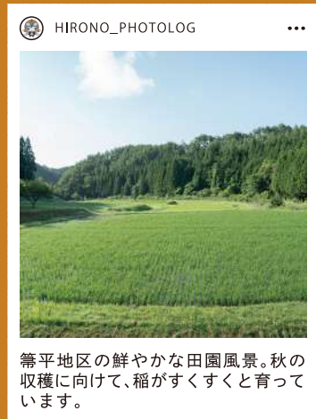
箒平地区の鮮やかな田園風景。秋の収穫に向けて、稲がすくすくと育っています。