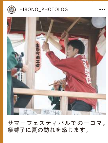
サマーフェスティバルでの一コマ。祭囃子に夏の訪れを感じます。