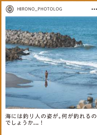
海には釣り人の姿が。何が釣れるのでしょうか...!