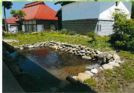
常に水のながれる音が聴こえる 風情のある裏庭の池