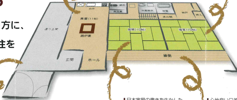
多用途の通り土間